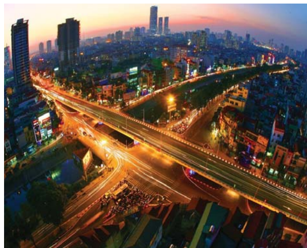
Schéma directeur de Hanoï d'ici 2030, avec vision à l'horizon 2050 19