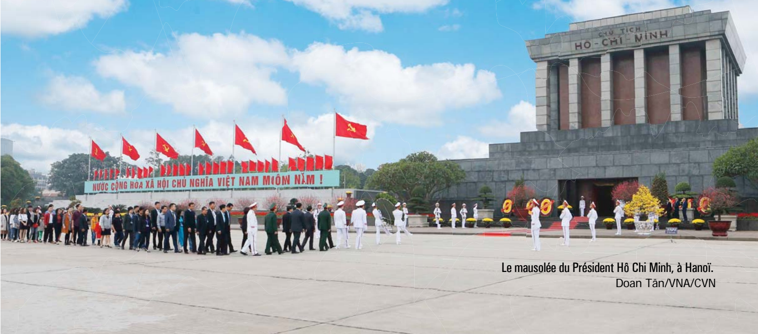
Le mausolée du Président Hô Chi Minh, à Hanoi.

Précurseur. Déterminé sur la base du marxisme-léninisme et la pensée de Hô Chi Minh, le Parti communiste du Vietnam dirige le pays pour un développement durable, inclusif et intégré, en s'appuyant sur la rénovation et la créativité, en perfectionnant les institutions de l'économie de marché à orientation socialiste et celles de l'État de droit socialiste.